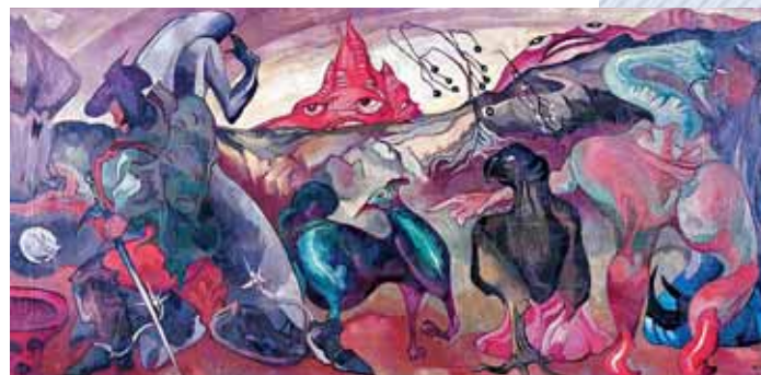
akwarela , farba wodna o spoiwie rozpuszczalnym w wodzie S. I. Witkiewicz: Fantazja , 1921–22