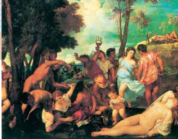
olejne malarstwo , technika malarska polegająca na posługiwaniu się farbami, w których spoiwem jest olej (głównie lniany); rozpowszechniło się w XV w. Tycjan: Bacchanalia na wyspie Andros , 1518–19