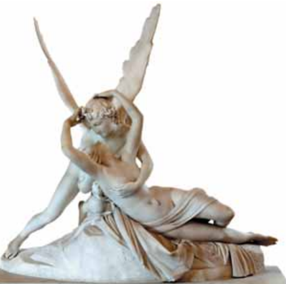
A. Canova: Amor i Psyche , 1783–93

relief , płaskorzeźba, kompozycja rzeźbiarska wydobycza z tła, przeznaczona wyłącznie do oglądania z przodu; różni się m.in. relief: płaski, wypukły i wklęsły (kompozycja cofnięta w stosunku do tła) Reliefy ze świątyni Horusa z okresu ptolemejskiego, IV–I w. p.n.e., Idfu,