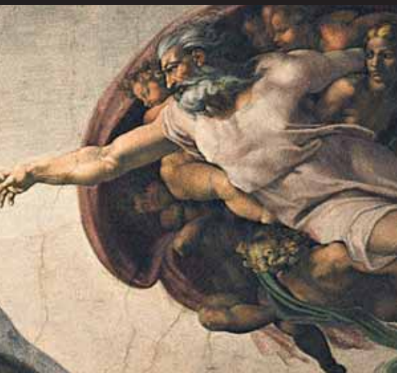
malowaniu na mokrym tynku, — Kaplica Sykstyńska, Watykan