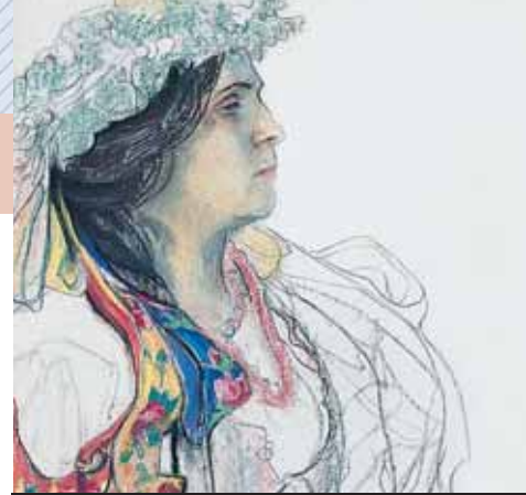
pastel , farba artystyczna w postaci miękkich kredek S. Wyspiański: Wanda Siemaszkowa jako Panna Młoda w Weselu , 1902–03