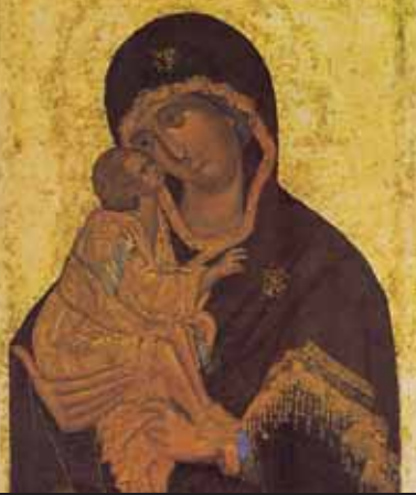
tempera , farba emulsyjna o spoiwie organicznym (np. z jaj ptasich, żywicy) Teofan Grek: ikona Matki Bożej Dońskiej , 1380 lub 1392